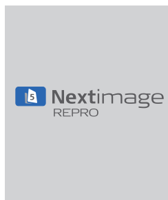
Nextimage REPRO software