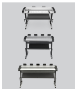
Your choice of scanner IQ Quattro 44 inches HD Ultra X 42 inches HD Ultra X 60 inches