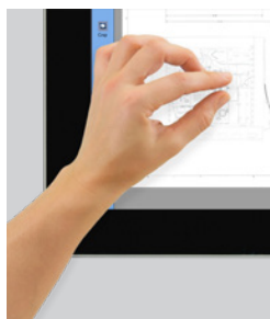
Touchscreen Full HD 21.5" touchscreen